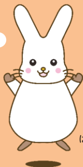
はぴくろマスコットキャラクター ふくちゃん