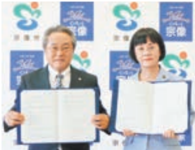
左から安成代表取締役、伊豆市長