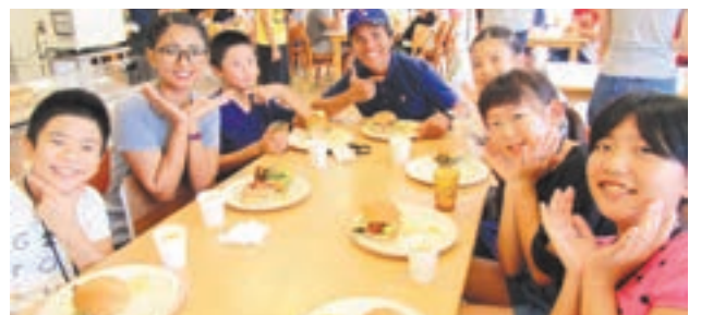
英語でオーダーしたランチで、みんな笑顔

【目的】英語に慣れ親しみ、英語への興味・関心を高める 【活動内容】英語でプレゼンテーション、ハンバーガー・アイスクリーム作りなど