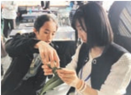
バディとニュージーランドの授業を体験

【目的】現地でのコミュニケーションを通し文化や価値観の違いを理解する 【活動内容】マウントロスキル校の授業に参加。生徒の家に一人でホームステイなど