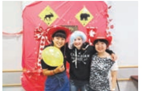
フェアウェルパーティー（お別れ会）でバディと笑顔の美春さん（左）

* 同研修は、宮若市、トヨタ自動車九州(株)と本市の3者協働で将来を担うグローバルな人材育成のため、地域の若者をカナダに派遣しています