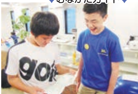
宗像の紹介や自分のことを頑張っている参加者（左）

* 12月にはガイドに必要な力を学ぶ「むなかたガイド研修」を実施。ぜひ参加してください。詳細は市広報紙 11月1日号で掲載予定です