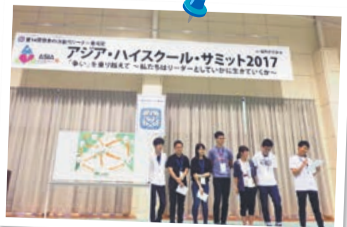
全国から集まった仲間と討論し発表

*申込方法など詳細は、募集要項を確認を。募集要項・申込書は、4月2日(月)から、子ども育成課窓口、市役所情報コーナーで入手か、市HP http://www.city.munakata.lg.jp/ →