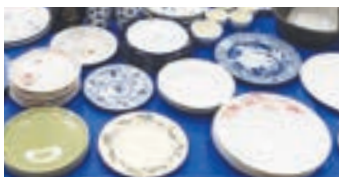
回収した陶磁器はリサイクルショップで無料配布