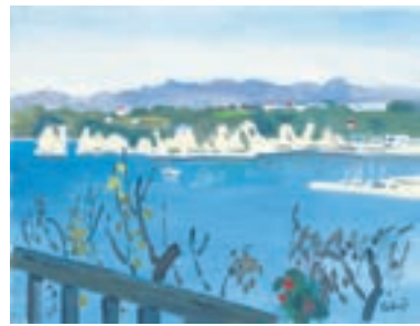
中村琢二「冬の小網代」 (昭和62年) 福岡県立美術館蔵