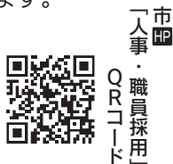
市 人事・職員採用 QRコード

●内容=地域の保健活動全般、健康教育(介護予防教室など)、健康相談、訪問指導など