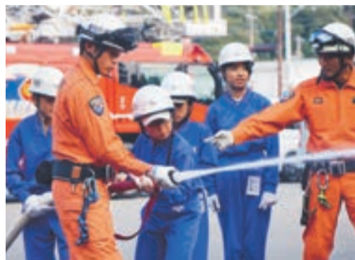
宗像消防署で放水訓練をする真剣な姿

同校では、4年前から日の里地区の17事業者の協力を得て、6年生を対象にミニワクワクWORK（職業体験）を行っています。体験自体は1日（半日を2日間）と短い時間ですが、児童が事業所へ直接体験依頼の電話をしたり、学校から事業所まで地図を見て行ったりと、その準備段階から児童が行っています。また、体験の中であいさつなどのマナーや交渉力など社会生活に必要な力を身に付けることも学びます。「命に関わる仕事をしたい」と消防署へ体験に行った児童らは、放水訓練やはしご車の試乗で、さらに夢が膨らんだ様子。「今日教えてもらった消防士さんは、明日休みで会えないから、きちんとあいさつして帰ろう」「集中して最後まで頑張ろう」と、気付いたことを言い合い、活動することで、自分で考え意欲的に取り組む力を育む貴重な体験になっているようです。