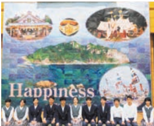
全員の力で完成した399枚の大作

文化祭オープニング、全校生徒とたくさんの来場者が見守る中、ステージには縦6m×横8mの、世界遺産に登録された沖ノ島などが描かれた壮大なモザイク画が照らし出されました。これは、生徒全員がA3サイズの用紙に印刷されたマス目を、それぞれ色ペンで塗りつぶし、貼り合わせて制作しているものです。用紙の配布時には、生徒たちは完成図を知りません。「色を塗っている