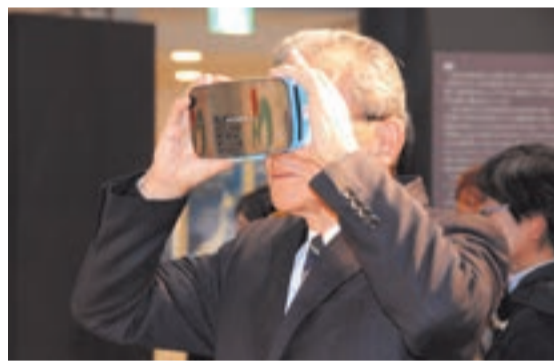
素晴らしい映像に見入ってしまいます

「沖ノ島8K×VR映像」は、N 私もさっそく 視聴したところ、 360度の広角 で見ることがで き、迫力満点! 8Kの高画質映像 はまさに沖ノ島に 立っているような 感覚になりました。 このVR映像は、入るこ とができない「沖ノ島」を 実感してもらうため、1月 1日から1年間の予定で海 の道むなかた館で視聴でき ます。市民のみならずこの 機会にぜひ沖ノ島を実感 してみてください。 *VR映像の特徴上、視聴 できるのは中学生以上にな ります ■問い合わせ先 秘書政策課秘書担当 ☎(36)0890