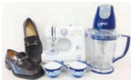
さまざまな物品があります

■問い合わせ先 市収納課 ☎(36)5392 *公売会当日は☎090(9074)3588(福津市収納課)に問い合わせを