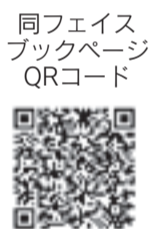
フェイスブックページ QRコード

*詳細は、市青少年海外派遣研修使節団 @http://facebook.com/munakata.junior.missionを確認できます