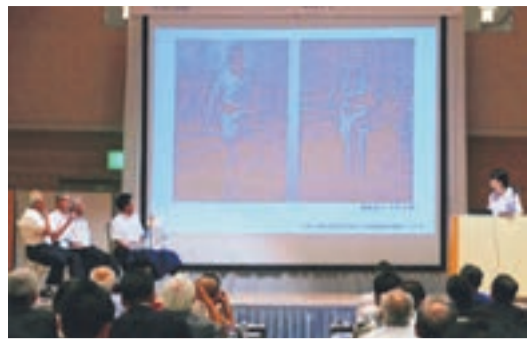
漁師のみなさんが海の変化を報告

宗像海人族をはじめ、私たちの暮らしは海とともにありました。これまでの市民を挙げた環境保護の取り組みもあって、「神宿る島」宗像・沖ノ島と関連遺産群は世界文化遺産に登録されました。しかし、海水温の上昇、生態系の変化、ゴミの漂流・漂着、海岸線の浸食など海の環境は急速に悪化して、宗像も例外ではありません。