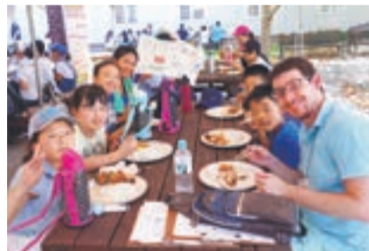
英語でクッキングに挑戦! おいしくできました

市内の小学5、6年生50人が8月24日、同25日に、グローバルアリーナで実施したサマーキャンプに参加。同キャンプは、外国人スタッフは全て英語で話すため、英語に親しむきっかけになる、楽しい活動がたくさん用意されています。最初は、静かな雰囲気でしたが、英語での名刺交換やグループ活動、インド料理のタンドリーチキンづくりなどを経て、みるみるうちに積極的になり、英語での会話を大きな声で楽しんでいました。外国人スタッフの出身国紹介では、さまざまな国の文化や習慣を知り、異文化理解を深めたようでした。