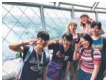
現地の高校生とナイアガラを体感!

宮若市、トヨタ自動車九州(株)と本市の3者協働で、同世代との交流を通じて将来を担うグローバルな人材育成のため、地域の若者を海外に派遣しています。12人の研修生(うち宗像市5人)は日本で事前研修を行い、7月31日から8月8日までカナダに渡航。現地では、ホームステイやカナダの高校生との交流、トヨタ自動車の海外生産・販売の現場見学を実施。そこで働く日本人のみならず、これからグローバルに活躍するために必要な力について話してもらいました。