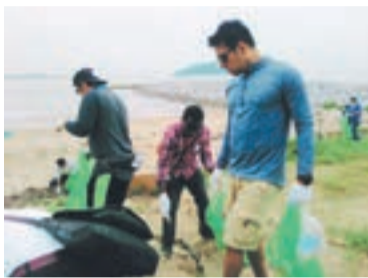
海岸清掃には留学生たちも参加

すため、さつき松原と大島の海岸清掃、竹漁礁づくりを行いました。さらに、市民環境団体と企業がそれぞれの活動を紹介し合い、協働の可能性について考えました。