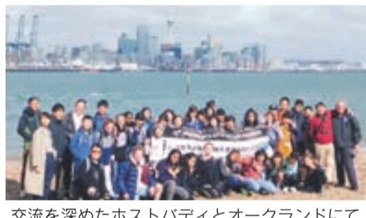
交流を深めたホストパティとオークランドにて

市では、国際的な視野を持つ青少年の育成を目的に、ニュージールランド(NZ)のマウントロスキル中