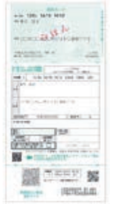
マイナンバーカード申請書