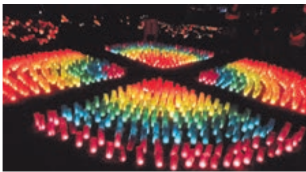
色とりどりの灯笼をぜひ見に来てください