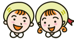
【表1】 保育所・認定こども園(保育利用)の案内

検索サイトで むむハグ 検索 http://city.munakata.lg.jp/kosodate/