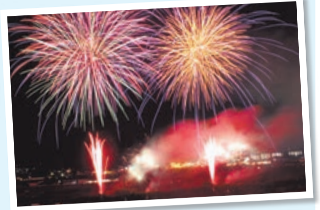
迫力のある見事な花火が打ち上がります(昨年の様子)

県道29号で結ばれる直方市・鞍手町・宗像市の2市1町は、地域振興と沿線地域の活性化に向けた連携事業を実施しています。