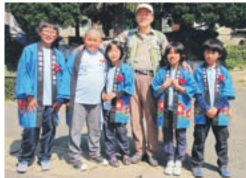
子どもたちの笑顔に元気をもらいました

地島名物の椿ごはんや、島民全員が参加するまつりの開催などのおもてなしに心から感謝し、地島を後にしました。