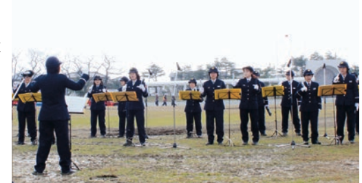
出初式に花を添える演奏を披露