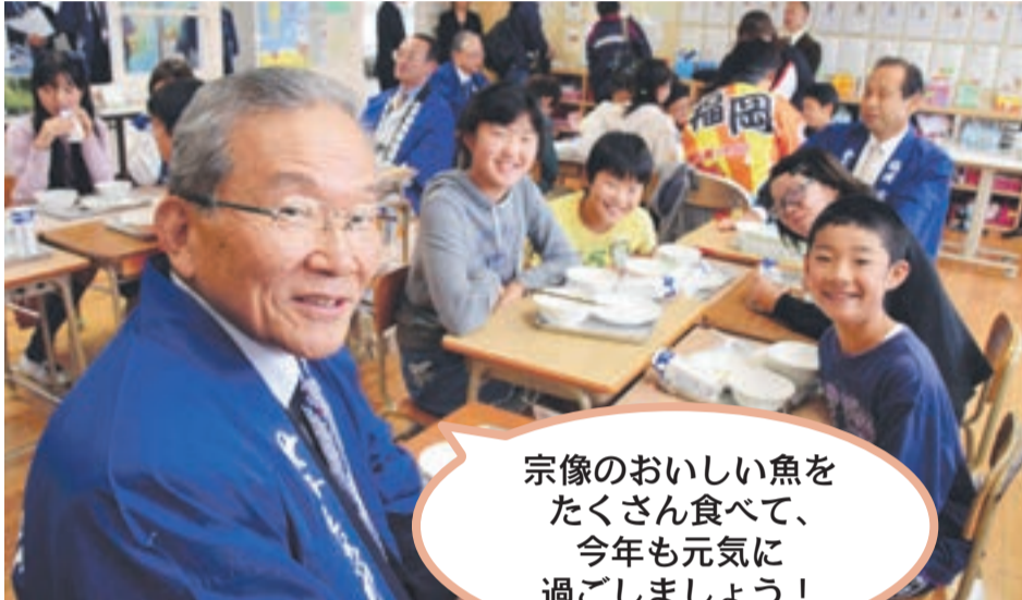
市内小学校でのフク給食の様子