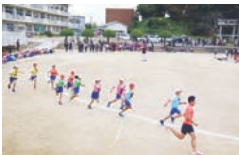
トップアスリートと一緒に走る子どもたち

トヨタ自動車九州陸上競技部のみなさんが11月10日、東郷小学校で体育科学習実技指導を実施しました。最初に、準備体操で