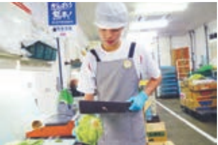
ゆめタウン生鮮コーナーで出荷準備している様子

みなさんは今、大きく成長する時期であり、いろいろなことに悩む年齢だと思います。しかし、将来自分がどの職業に就くのか、選ぶのは自分自身です。いろいろな職業があることを知って、実際の声を聞いて、思いを知ってください。そして、後悔のない人生を歩んでほしいと思います。