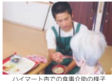
ハイマート杏での食事介助の様子

今年、9月12日から同日までの5日間、244事業所の協力のもと実施しました。普段の学校生活から離れ、働く人々と直接触れ合いながら過ごす5日間は、子どもたちにとっても貴重な時間になりました。幼い頃から、親や教師から繰り返し言われてきた「あいさつ」の大切さ、他人に対して親切にすることの尊さ、一生懸命やることの意義など、自分がこれまで、このようなことにならなければ真剣に向き合ってきたかを知る時間となります。今の自分は社会で通用するのかが、何が足りないのか、今後どのようにしていったらいいのか、身をもって感じたことでしょう。