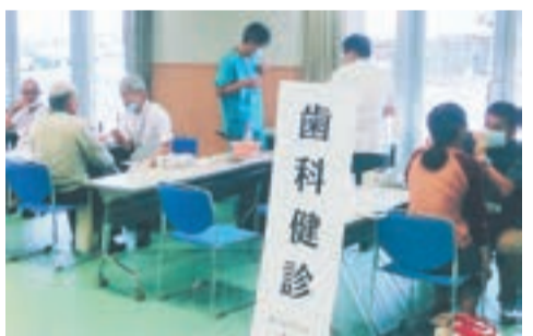
歯科医が一人一人をしっかりとチェック (昨年の様子)

宗像歯科医師会では、子どもから大人まで、楽しみながら歯の健康について学んでもらうため、「いい歯、いい歯。」週間 (11月7日、同8日を含む1週間) に合わせて、「第20回 宗像めざせ！ 8020 (ハチマルニイマル)」を開催します。 「8020」とは、「20本の歯が残っていれば、ほとんどの食物をかむことができ、おいしく食べられる」ことから、「80歳になっても自分の歯を20本保とう！」という運動です。ぜひ参加してください。