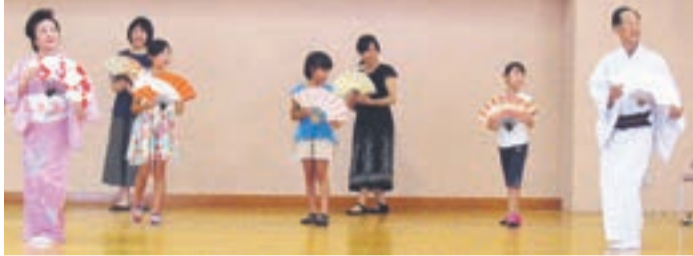
日本の伝統を楽しく体験しませんか(舞踊)