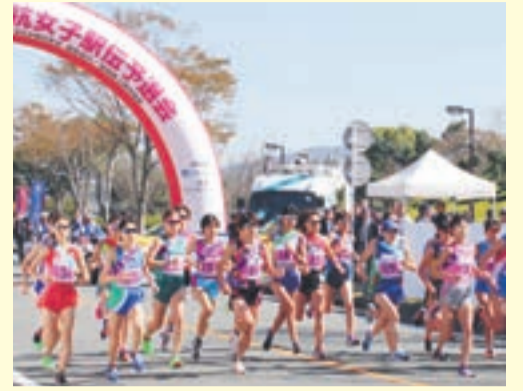
規模が拡大された女子駅伝(昨年のスタート)

全国3地区(東日本、中日本、西日本)に分かれていた女子駅伝大会の予選会が昨年から一本化されました。大会の規模が拡大され、参加チームも増えて、大いに盛り上がっています。