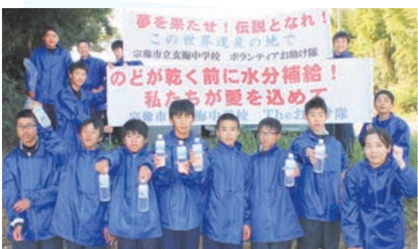
給水所で選手を支えた玄海中学校の生徒たち

学校内ポスターでボランティア募集をしていたので応募しました。ぶっつけ本番で頑張りました。このような機会はなかなかないので、参加して本当に良かったです。選手が走るスピードを落とさずに、いかに上手に水を渡せるか気がつけました。選手が手を伸ばすので、水を取る瞬間が分かりました。自分の手を離すタイミングが難しかったけれど、選手が一度も水を落とさなかったのが良かったです。 （玄海中学校の生徒たち）