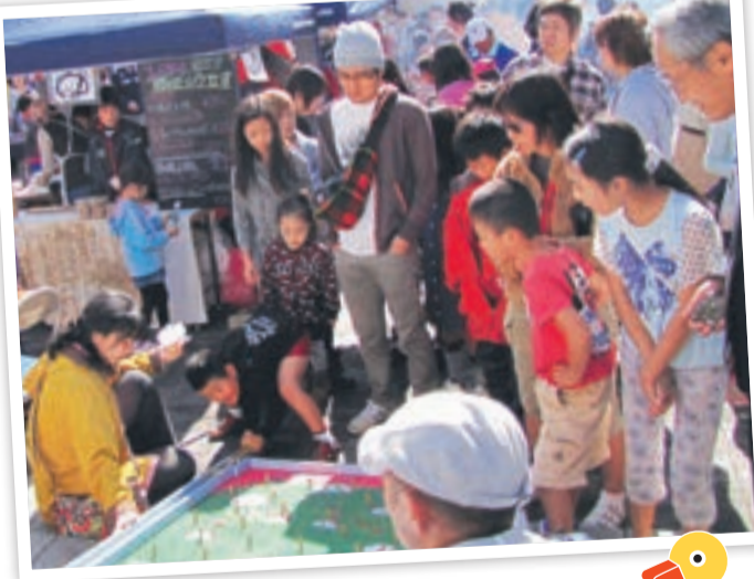
多くの来場者でにぎわう子どもまつり(昨年度)

● 日程 11月1日(日) ● 時間 午前9時50分～午後3時30分 ● *開会式終了後、出店開始 ● 場所 宗像ユリックス ● 問い合わせ先 子どもまつり実行委員会事務局(子ども育成課) ☎ (36) 1214