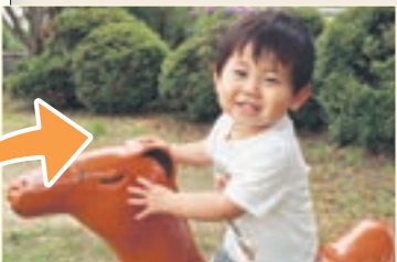
市ホームページにみんなの笑顔があふれます（掲載イメージ）