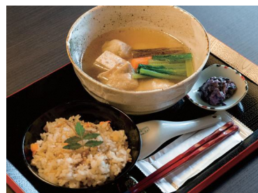
鯛めし雑煮セット