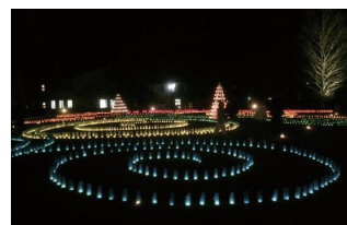
グローバルアリーナ