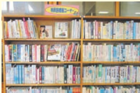
大島小・中学校内の「市民図書館コーナー」