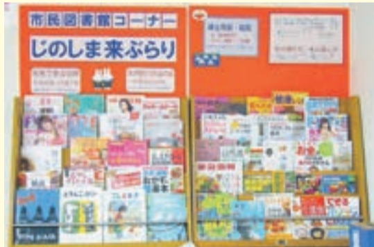
地島の「じのしま来ぶらり」

* 詳細は、市民図書館のHP http://munakata.milib.jp/ で確認可