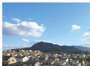
公園からの眺めです。