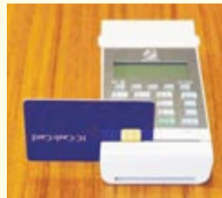
窓口に設置した 口座振替受付専用端末