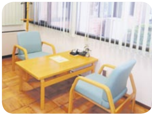
相談室は、くつろげる雰囲気 で秘密が守られる空間です

同相談室では、専門の相談員が、一人一人の気持ちや大切に受け止め、問題解決に向けての支援やアドバイスを行います。どんなにささいなことでも、一人で悩まずに相談してください。個人情報や秘密は守ります。同相談室の平成24年度の相談件数は、376件（面接162件、電話195件、メール19件）でした。相談内容別件数と相談者年代別比率はグラフ1、2のとおりです。