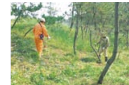
さつき松原での草刈り