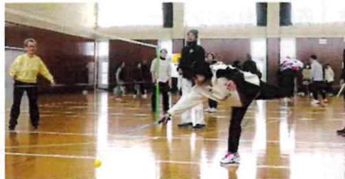
ナイスコントロール