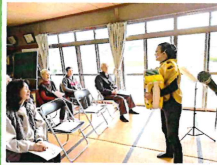
主催 玄海地区コミュニティ 参加者 12名