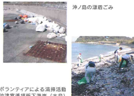
ボランティアによる清掃活動 沖津宮遙拝所下海岸（大島）

現在、多くの団体や個人の方々々が海岸をはじめとする清掃活動に取り組んでいただいております。「世界遺産を守る人々の輪」が広まりつつあります。