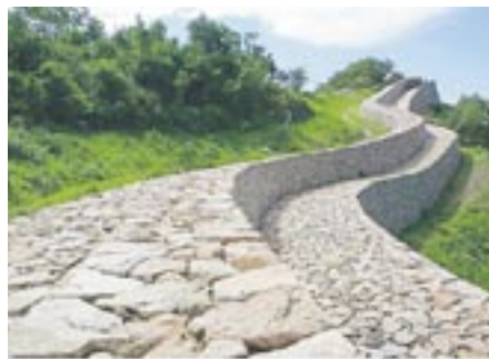
900mにも及ぶ盆山城の城壁

金海市中心部に程近い盆城山（ブンソンサン・標高330m）には、伽耶時代に築造されたと推定される盆山城があります。盆山城は、山頂を取り巻くように900mにも及ぶ石積みの城壁を巡らせた山城です。