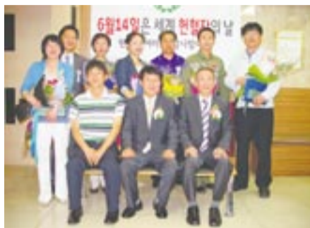
献血表彰を受けた人々

毎月15日号で、市と姉妹都市の締結をしている韓国・金海(キム)市の広報紙を紹介しています。