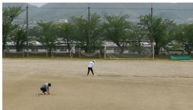
みんなの安全な体育祭に向けてグラウンド整備 (保健体育科の先生方)