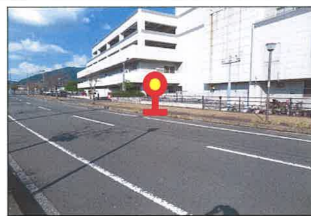
「くりえいと3丁目」バス停 (コスモス側)