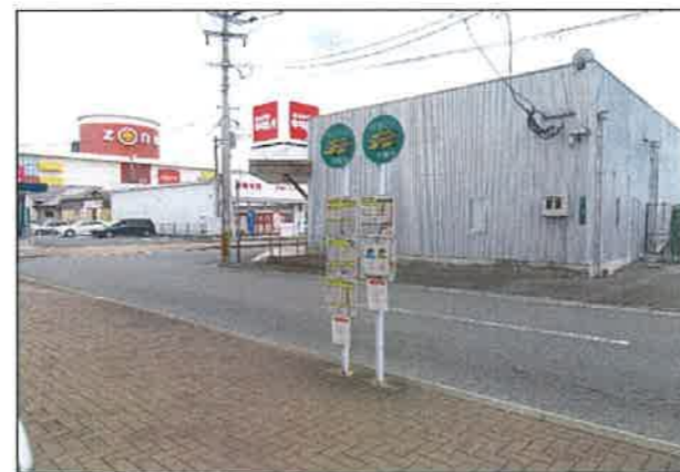
「くりえいと3丁目」バス停 (移設元)