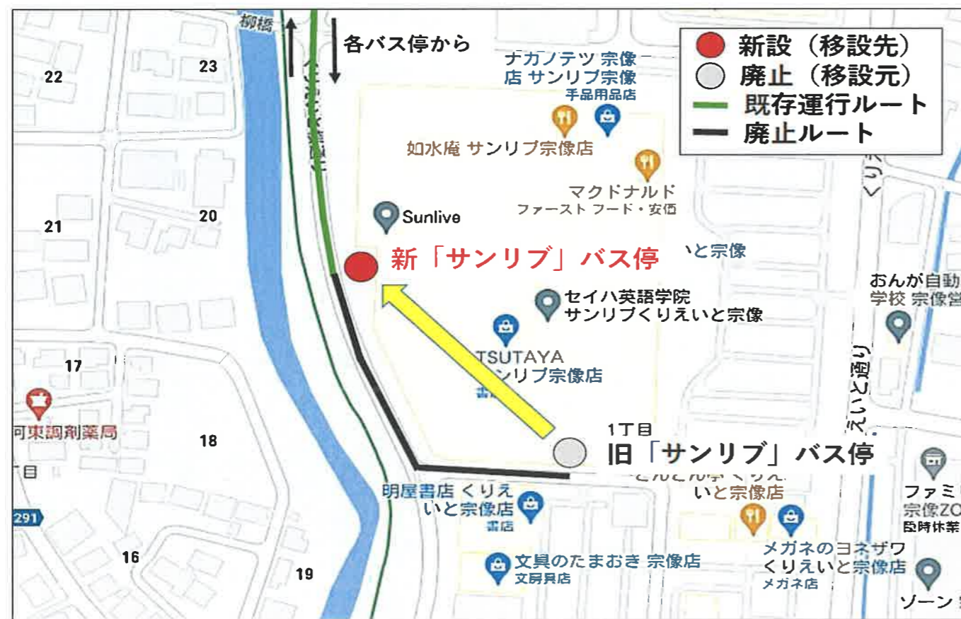
「サンリブ」バス停(移設先)

場所: (移設先) くりえいと1丁目5-1地先 (移設元) くりえいと1丁目5-10地先