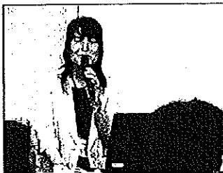
正路指導主事からの報告