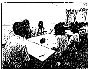
少人数分かれて話し合い