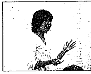
毛利教諭(河東小)による実践報告