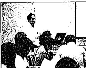
高宮特任教授による講話1