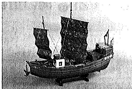
日宋貿易で使われた船(模型:福岡市博物館所蔵 作成:遠尾正博)

その強い繋がりを示す一つとして、一筆一切経のが上げられます。当時はまだ高級品であった「紙」や「墨」を大量に使用するこの一大事業の達成の影には、日宋貿易で巨万の富を得た大貿易商たちとの深い繋がりをみて取ることができます。