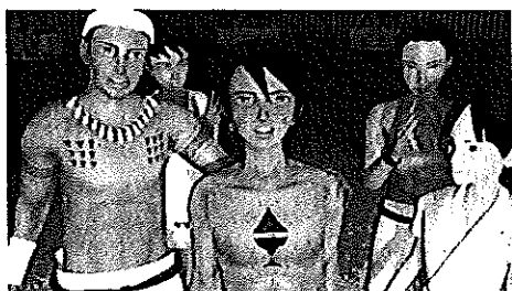
※全6話。第2話は今秋公開予定です。

3Dアニメ「海の民 宗像」は、他の豪族やヤマト王権、そして大陸諸国と関わりながら、新たな文化を取り入れ、宗像の地を守っていく宗像一族を描いた物語です。第1話は、沖ノ島の祭祀が始まる以前の弥生時代のお話です。みなさん、ぜひご覧ください。