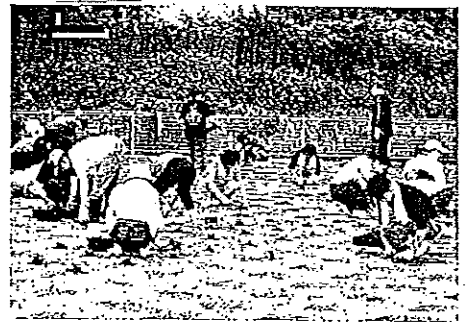
ポット芝の植え付けはかんたん!