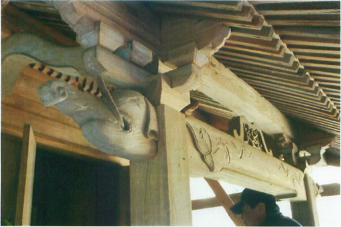
平山天満宮本殿 (木鼻・虹梁)