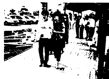
視覚障害ガイド体験