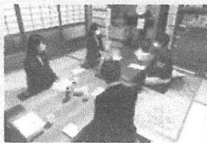
◀実際に子どもの居場所主催者の方のお話を伺いました。

学ぶ機会を提供することが重要である。本市においても、フリースクールやフリースペース、学習サポートなど子ども、若者の居場所の量や質をより充実させていくための支援が必要ではないか。