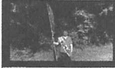
宗像市議員 安部よしひで 教えて!よっチャンネル。 全力釣川!下ってまし-