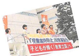
警固公園にて児童虐待防止街頭演説実施