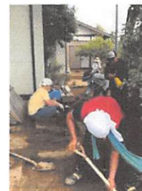
九州北部豪雨の際、市民の方と災害支援に。熱中症で倒れる人続出