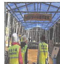
自由の森遊歩道のボランティアに参加