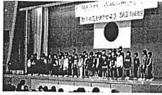
小学校と地域が合同で開催している文化祭や宗像市子どもまつりで縄跳びやダンスを披露