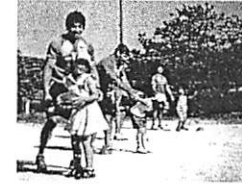
ラグビー、バスケットボール、サッカー、ダンスなど様々な競技を実施。ラグビーは、グローバルアリーナを本拠地とする宗像サンックスブルースの選手たちが指導