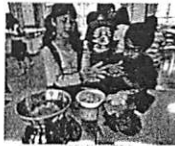
小学校やコミセンの休業日に、学童の活用場所として施設を利用。学校休業日には、プールや家庭科室を利用。コミセン休業日には、コミセンが学童保育の活動場所