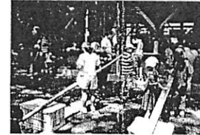
家庭で過ごす時間が長くなる夏休みに、家庭では味わえない体験活動を提供。野外活動で、竹を使って箸と器を自分で作り、そつめん流しのそつめんを食べる