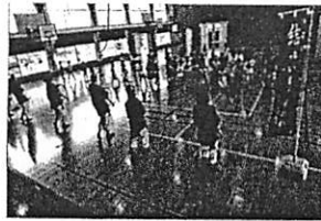
日赤看護大学のエイサーサークルに所属する学生が、放課後の時間、小学校の体育館を使って子どもたちにエイサー体験を提供