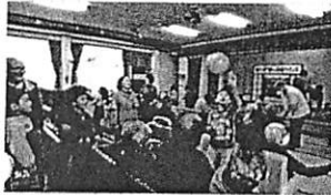
高齢者施設で、施設利用者と子どもたちが出し物の披露やレクリエーションで交流