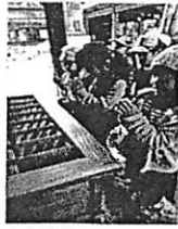
徒歩圏内にある八所宮に初詣