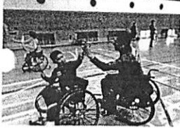
グローバルアリーナの協力で、パラバドミントン日本チームや7人制ラグビーのロシア代表チームなどと交流