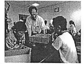
『学校で行わない活動』と『相手が必要な活動』を設定