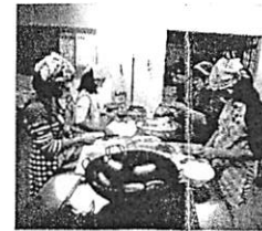
地域の施設を活用した通学合宿では、子どもたちに生活づくりの場を提供。教え合う姿や助け合う姿が生まれ、子どもたち同士や子どもたちと運営に関わる地域の人たちとの絆が生まれる。また、問題を自分たちで解決しようという姿勢が育つ