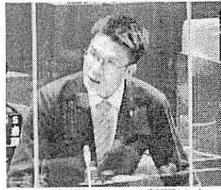
医療体制について質問に立つ

このために、片道1万円もの海上タクシー代を患者が負担しなければなりません。これは医療を公平に受ける機会が奪われていることとなります。地域包括支援センターの職員や、在宅医療機関のお医者さんにもこのことに心を痛め