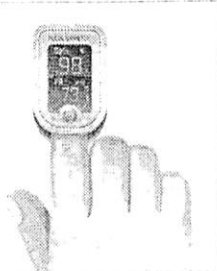
パルスオキシメーターで体内の酸素濃度を測定する

「体内の酸素量が急激に減ることが分かっているがなぜ、自宅療養者がごまかに酸素量を計測できるように、パルスオキシメーター貸し出しの体制を整えていないのか？」