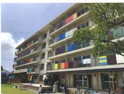
今年5月にオープンした、日の里東部生活拠点生活利便施設「ひのさと48（よんじゅうはち）」。

これに対しては、UR日の里一丁目団地跡地活用の検討も含め、住民や民間事業者の提案を受けてビジョンをまとめ、将来像を多くの方に共感いただくなかで、再生の取組みが地区全体に波及することを期待していること。また、駅前のエリアマネジメント活動を担う団体の支援策として、都市再生推進法人の指定も視野に検討していることが明らかにされました。