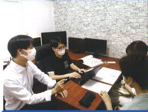
今夏の学生インターンたちと 政策提案に向けた検討会議