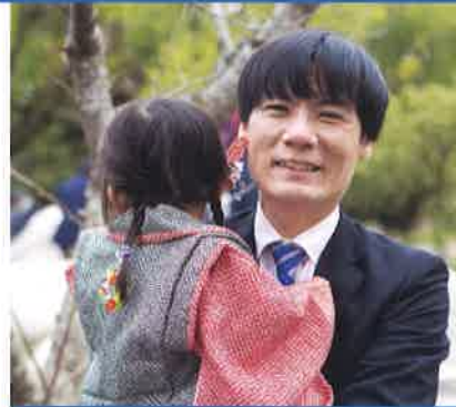
昨秋、宗像大社に七五三詣で