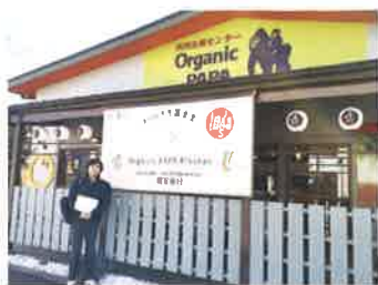
有機JAS認証の農産物を作っている「オーガニックパバ(筑紫野市)」を訪問