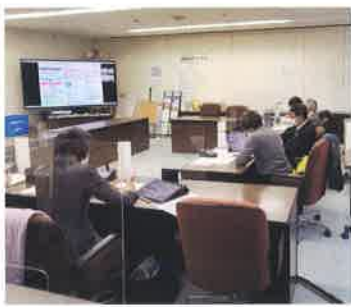
公共施設の包括管理委託を行っている茨城県古河市にオンラインで聴き取り調査

市側からは、国の方針の中でも公共施設などでの徹底した省エネと再エネ調達など、脱炭素社会の基盤となる重点対策が示されており、今後の取組みをまとめる中で検討したいとの答弁がありました。