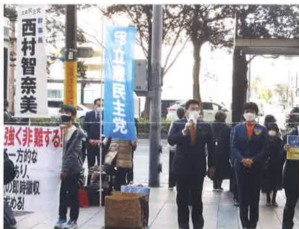
3月5日、立憲民主党幹事長・西村智奈美衆議院議員（右）、古賀ゆきひと参議院議員（中央）と共に、福岡市天神でロシアのウクライナ侵攻に対する抗議活動に参加。

今夏に行われる参議院議員選挙では、政党に所属する身として市民・有権者の皆様に政治への関心と期待を持っていただけるよう、足元から活動してまいります。