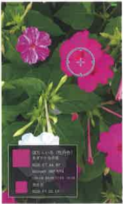
スマホのカメラを使って、色彩を調べられるアプリも。「ぼたん色 あざやかな赤紫」と画面上に出ています。

次の質問では、特定の色が見えにくい「先天性色覚異常（色弱等）」のある人（日本では男性で約5%、女性で約0.2%）だけでなく、白内障の人など、より多くの人が見やすい配色や