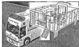
協力：日本赤十字社熊本県支部 G06