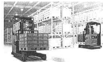
協力：トヨタL&F熊本(株) K08