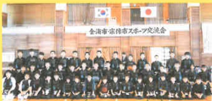
2015、16年 宗像市・金海市スポーツ交流