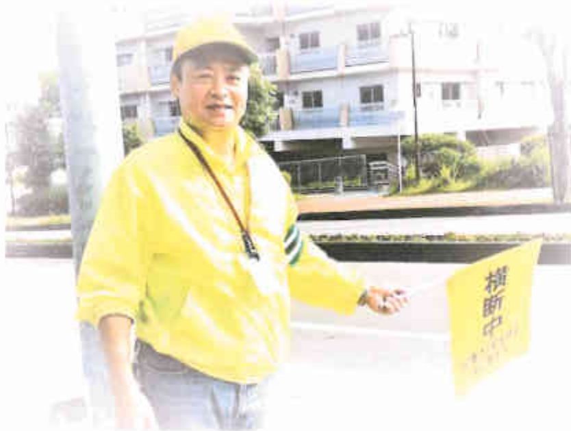
宗像市交通安全協会/朝の通学見守り活動