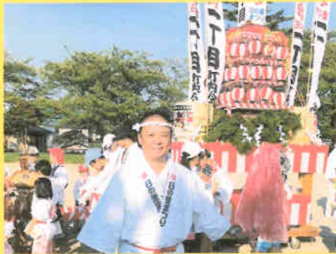
日の里まつり/1丁目の神輿の前で