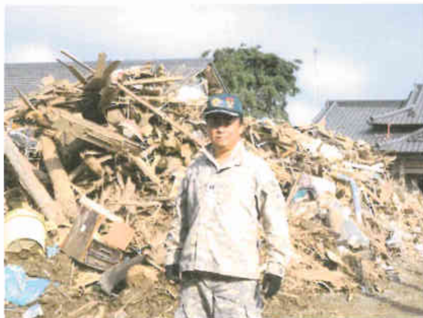
近年の度重なる地震や豪雨の被災地に災害ボランティアとして参加