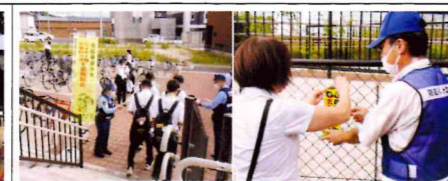
【粕屋】JR酒殿駅において、自転車盗被害防止のため、「自転車盗に気を付けて!」のステッカーを掲示するとともに、駅利用者駐輪時のツーロックを呼びかけ。