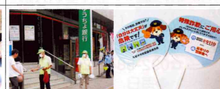
【久留米】年金支給日に、通称「銀行通り」で、警友会や金融機関防犯連絡協議会等との協働により、二セ電話詐欺被害抑止「ミノウチわ」を配布し注意喚起。