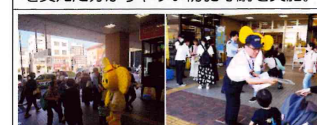
【博多、春日、大野城、那珂川】夏季に性犯罪の増加が懸念されるところ、両防犯協会は合同で、JR南福岡駅及び博多・春日署との協働により、同駅において性犯罪等被害防止対策として防犯キャンペーンを実施。女子学生など駅利用者に対し、「まも活手鏡」をはじめ、ウェットティッシュやチラシを配布し被害防止を呼びかけ。