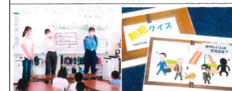
【城南】夏休み中に、福岡大学学生ボランティア「ななくま元気にするっ隊」との協働により、小学校において、クイズ形式による児童にもわかりやすい防犯教室を実施。