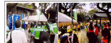
【東福岡】宮崎宮「放生会」期間中の7日間、各防犯組合長及び組合員各種団体が、少年非行防止や犯罪未然防止のため参道や周辺を夜間パトロール。