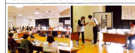
【飯塚】桂川町民生委員に対し、二セ電話詐欺対策としてキャッシュカード詐欺(カードすり替え詐欺)をテーマに、笑いを変えたわかりやすい防犯寸劇を実施。