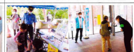
【八女】管内の総合リゾート施設で各種犯罪被害防止を、年金支給日には金融機関ATMで二セ電話詐欺被害防止を、それぞれ啓発チラシ等を配布し注意喚起。