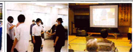
【宗像】大規模商業施設で、女性従業員に対し性犯罪被害防止訓練を実施。渡区公民館では、高齢者に対し実際の事件をもとにした動画等を放映し注意喚起。