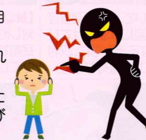
【福岡県警察が児童虐待の疑いで児童相談所に通告した児童数】