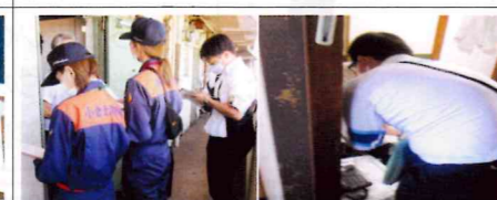
【小倉北】小倉北消防団の女性消防団員が活動する「いきいき安心訪問」に同行し、一人暮らしの高齢者に対し、二セ電話詐欺等について防犯指導を実施。