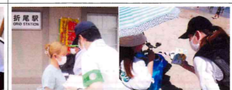
【折尾】JR折尾駅前及びレジャープールにおいて、性犯罪等被害防止キャンペーンを実施。女性や子供に対し、防犯チラシや啓発グッズを配布し注意喚起。