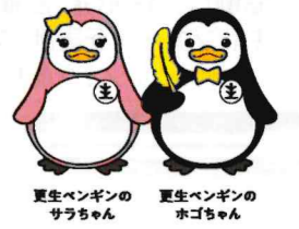
更生ペンギンのサウちゃん 更生ペンギンのホゴちゃん

“社会を明るくする運動”は、すべての国民が、犯罪や非行の防止と犯罪や非行をした人たちの更生について理解を深め、それぞれの立場で力を合わせ、犯罪や非行のない安全で安心な地域社会を築くための全国的な運動です。