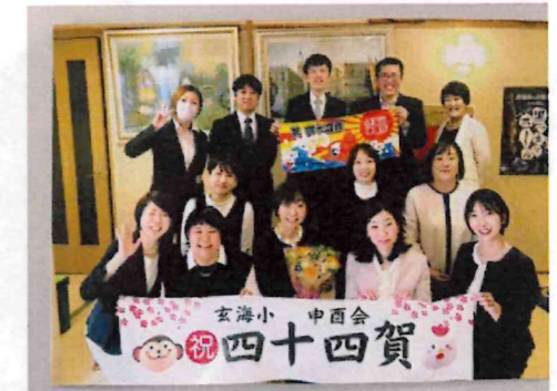
恩師を囲んで(参加者12人) 4月2日