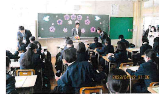
新たな教室で、新しい仲間と!