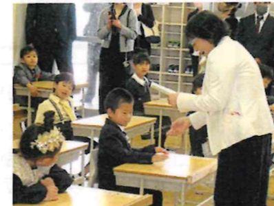
話をしっかり聞けるかな!